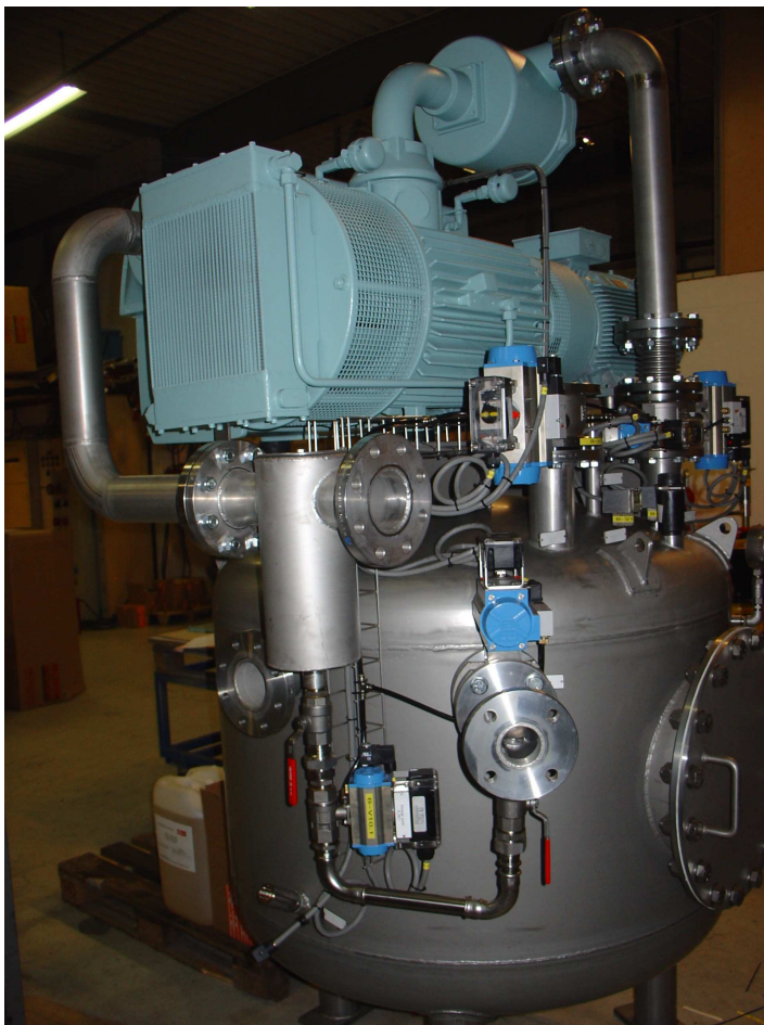
System under bygging