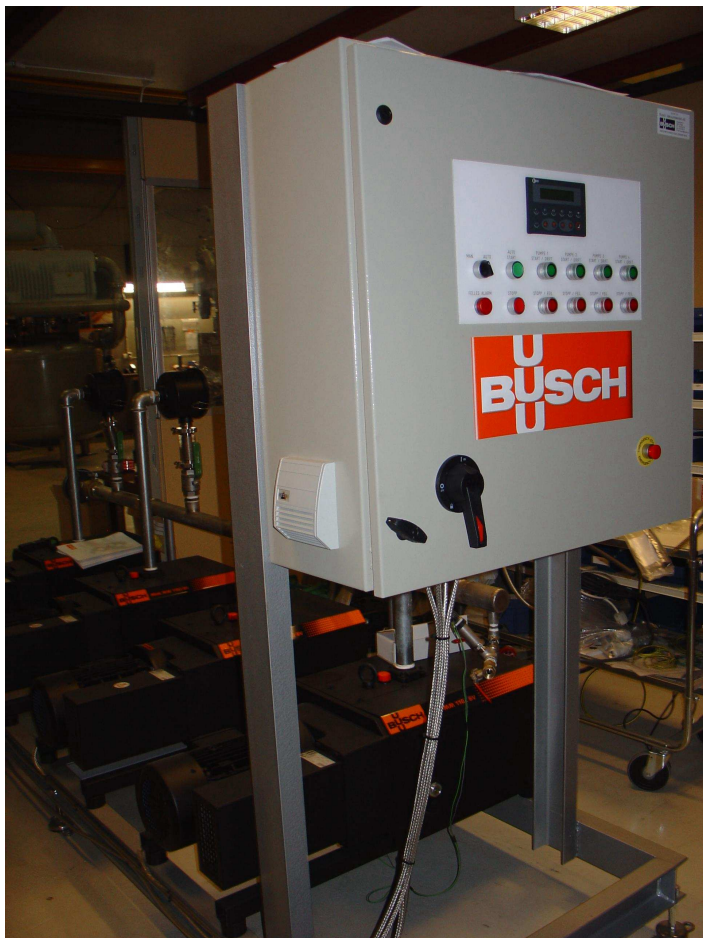
System under bygging