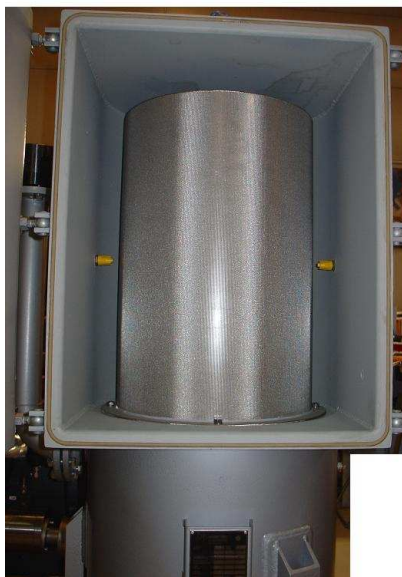
Innside av filter